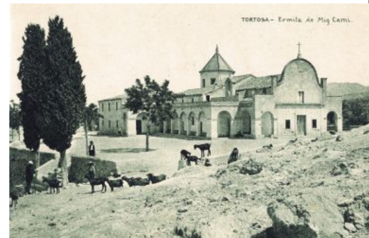
Ermita de Mig Camí, Tortosa.

Mostra fotogràfica sobre la festa de l'ermita de Santa Magdalena, a càrrec de l'Associació Pi del Broi, del Pinell de Brai.