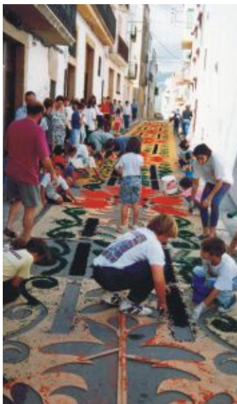
Elaboració de catifes en honor de la Mare de Déu de Pallerols a la Sénia. Anys 90.